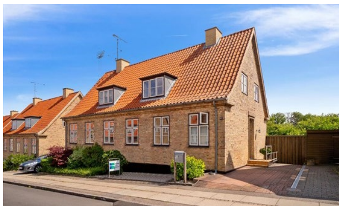
6. Ældre boligbebyggelse på Godthåbsvej, opført som dobbelthuse i gule teglsten, med fine deltaljer og proportionering