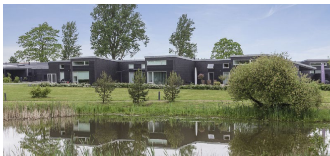
4. Nyt boligområde ved Wegenersminde, opført som rækkehuse og kædehuse i 1-2 plan. I området har der blandt andet været fokus på regnvandshåndtering, hvor regnvandet opsamles og bidrager rekreativt til området.