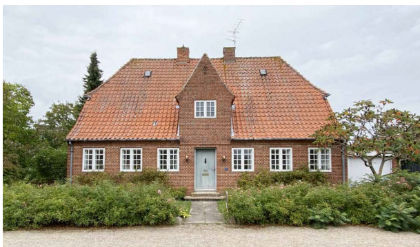
1. Bakkekamskvarteret med de mange fine bygninger fra "Bedre Byggeskik"-perioden, opført ca. fra 1915-1925