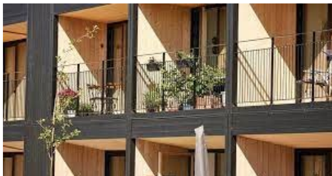
2. Nybyggeri på Østerled opført i træ, som ældregnede boliger