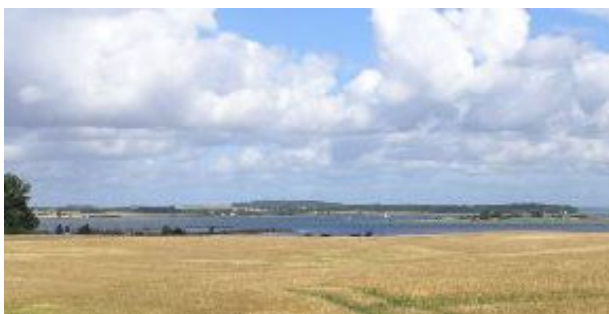
3. Det fredede landskab ved Wegenersminde, med kig over marker, fjord og til Tuse Næs og Kirsebærholmen.