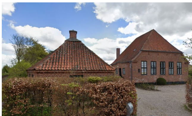
2. Ibs forskole fra 1914, mellem Mørkøv Kirkeby