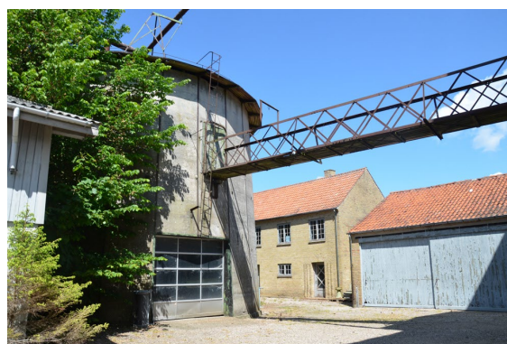
6. Savværkets historiske bygninger står stadig og vidner om en industri der har haft stor betydning for Mørkøvs udvikling.