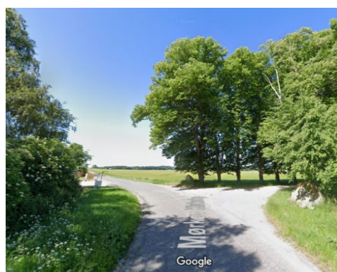
4. Alléen op mod Toftholm gods