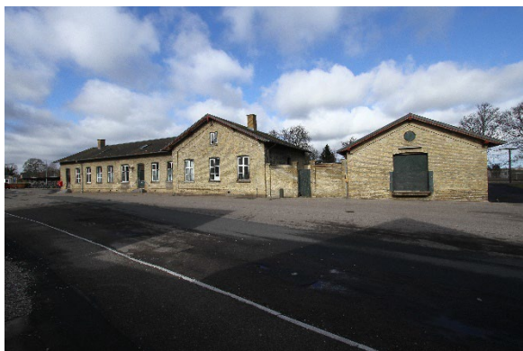
1. Stationsbygningen fra 1879 er bevaringsværdig og vigtig i fortællingen om Mørkøvs opståen og Mørkøv. og udvikling, men mangler i dag en funktion.