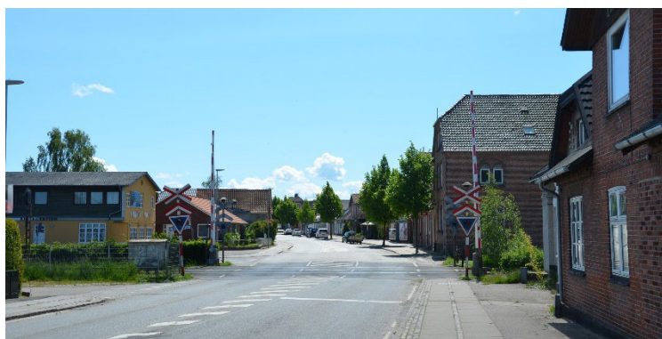
5. Mørkøv Hovedgade Mørkøv Kro og Hotel på venstre hånd og købmandsgården på højre hånd