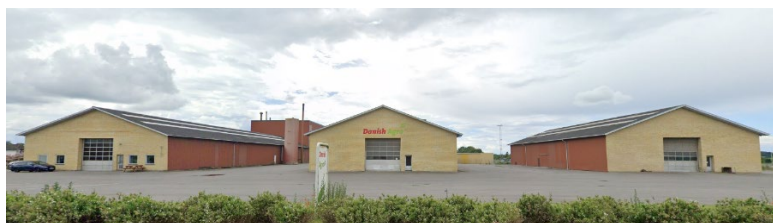
5 Danish Agro, opført i 1977 -1985, dengang lå der stadig Svinninge Valsemølle fra 1916 langs sporerne. Svinninge Valsemølle blev fjernet i 2001. Tilbage står Hallerne der i dag anvendes af Danish Agro.