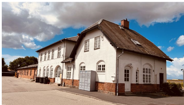
1 Svinninge Station, opført i 1900 af DSB's ledende arkitekt Heinrich Wenck. Bygningen rummer i dag bolig og lager.