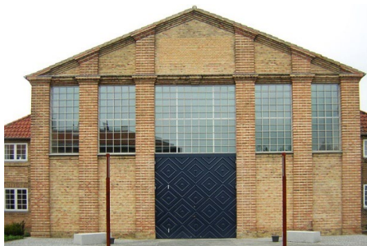
2 Andel Energi, Svinninge Elværk, opført i 1913 bedre byggeskiks arkitekt Ivar Bentsen. Bygningen bruges i dag som konferencesal.