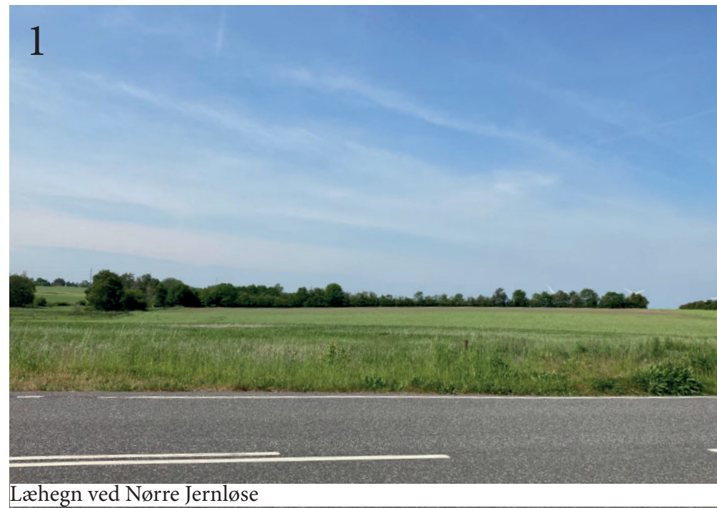
Læhegn ved Nørre Jernløse