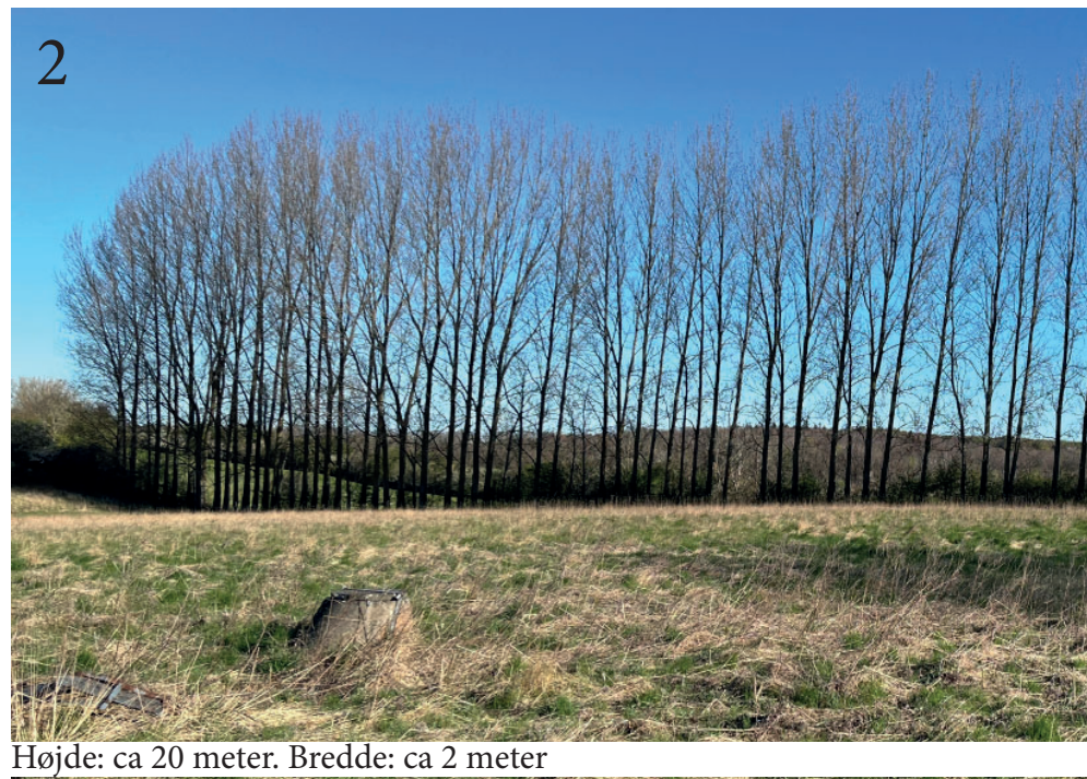
Højde: ca 20 meter. Bredde: ca 2 meter