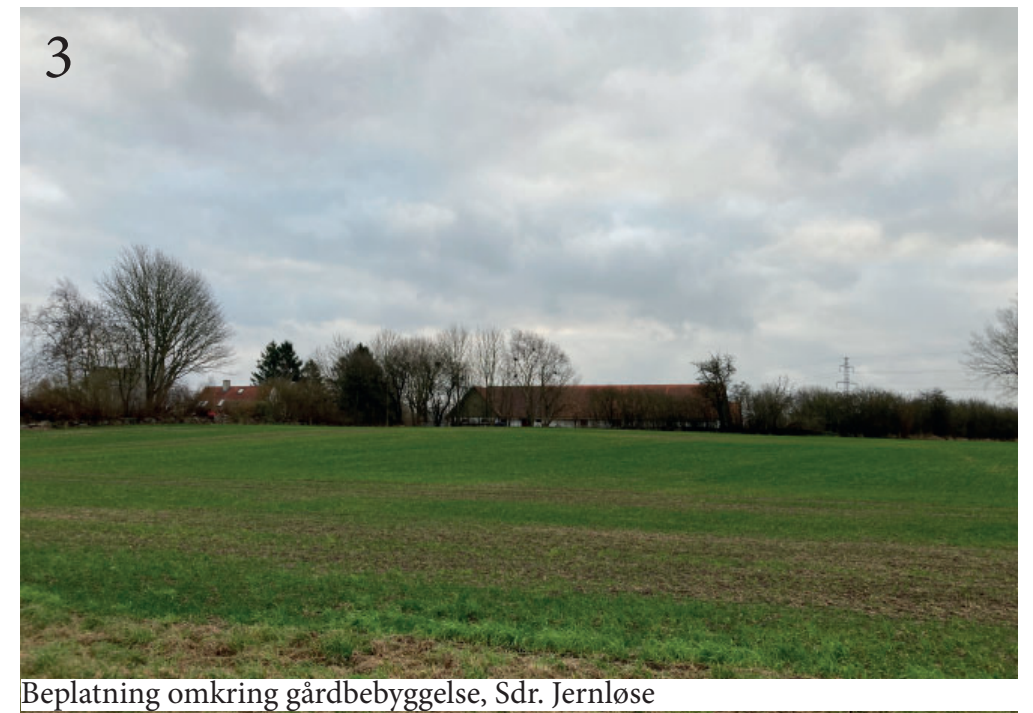
Beplantning omkring gårdbebyggelse, Sdr. Jernløse