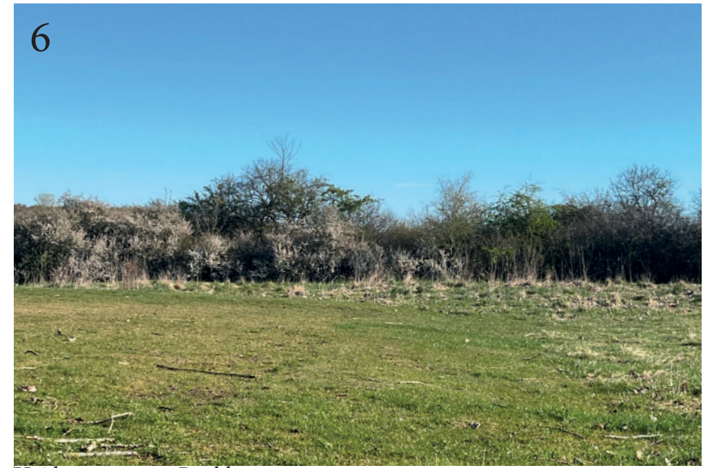
Højde: ca 5 meter. Bredde: ca 5 meter