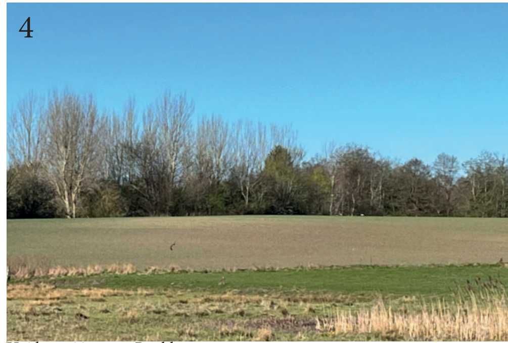
Højde: ca 20 meter. Bredde: ca 7 meter