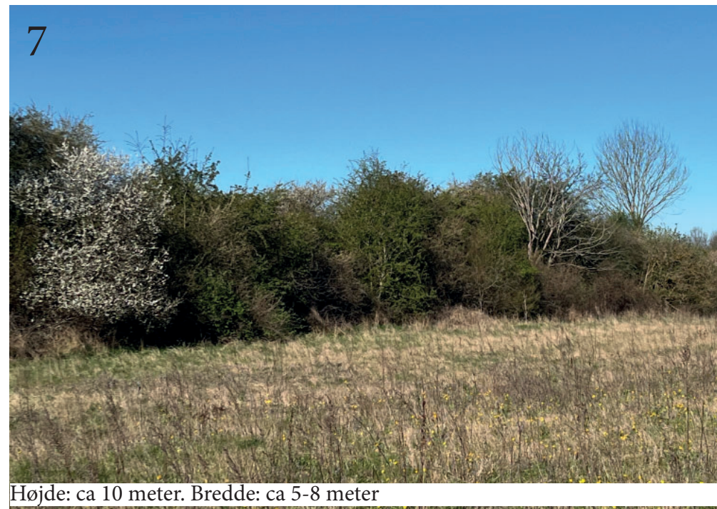
Højde: ca 10 meter. Bredde: ca 5-8 meter