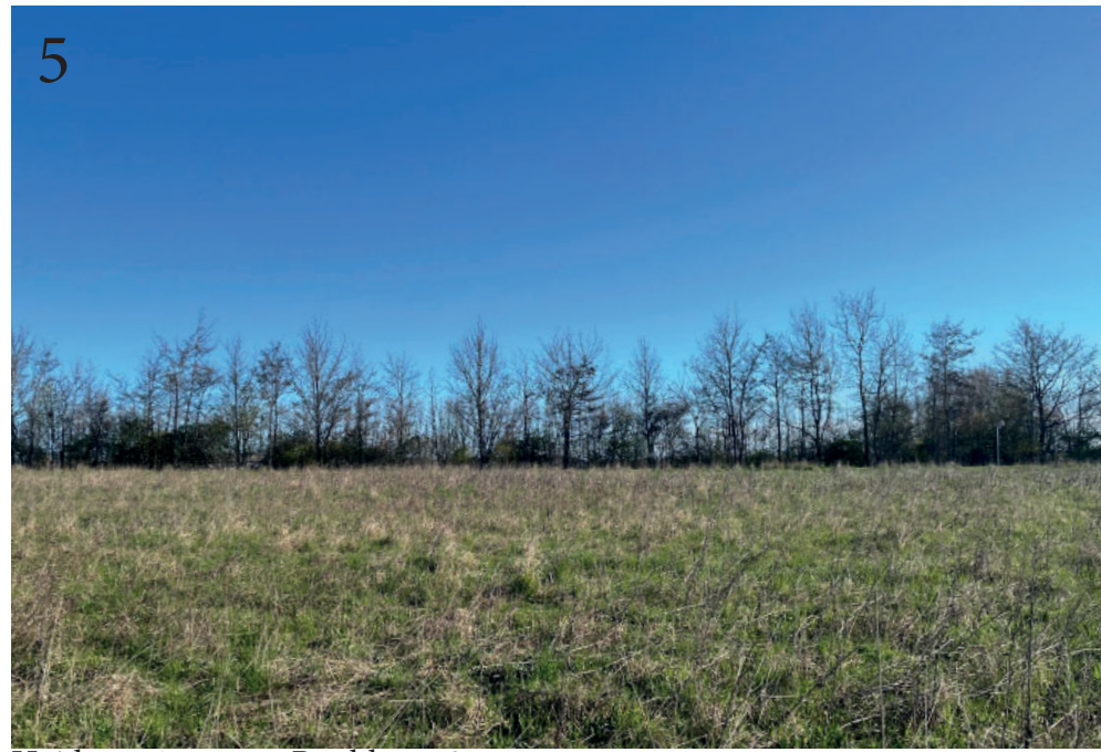
Højde: ca 15 meter. Bredde: ca 3 meter